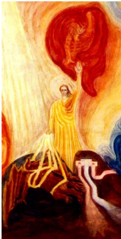
Ravnovesje med Luciferjem in Ahrimanom

Ko težavnost trenutnega stanja ne bo presežena v srcih ljudi in v primeru, da močna, odločna volja ne bo usmerjala življenja duš tistih, ki se ukvarjajo s temi velikimi resnicami, bo njihovim dušam zagospodarilo Bitje Lucifer.