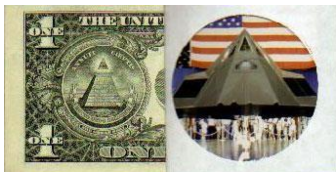
Večna patokracija dajatev

Kaj je storiti? Obvestiti javnost, vse podrobnosti, vse moči, vsi reševati človeško raso, večina totalno nezainteresirana, nacija zaspanih ljudi, dovedeni v pokol, čas za vstajo, naši predniki, hodimo kot ljudje. Ne upirajte se, delajte tisto kar bi morali že zdavnaj! Zanimajte se, kaj vlada počne, sklicujte se na Ustavo, Zakone, kličite svoje predstavnike, politike, vršite pritisk na njih, da se zberejo, izpovedo resnico. Resnico! - ne praznih besed, če ne poznate zakonov, ste že nemočni/mrtvi, povejte jim - je njihova zadnja služba, druge ne dobijo, pišite jim, isto govorite, v vaši so bližini, pridite s skupino, delegacijo, obiščite jih, prisilite jih razumevanja, imamo moč le pozabili smo, glasujte prav - pridobite moč, ne napak - moč izgubite, potrebujemo patriote, ne za male ribe, prave so na vladi...(izvor: www.montalk.net/alien , prirejeno, dopolnjeno)