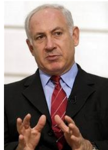
Benjamin Netanyahu, politički psihopat.

Komentar: Svi opisi psihopata i psihopatije u prijašnjim dijelovima serije Osnove ponerologije se mogu primijeniti i na svijet politike. Štoviše, zbog tolike koncentracije moći i utjecaja koju u današnjem svijetu ima politika, ona je pravi mamac za psihopatološke pojedince. Kako su političari oni koji kroje zakone, odnosno određuju "pravila igre" u društvu, velika većina ljudi se i ne znajući posve prepušta možebitnim psihopatima na milost i nemilost.