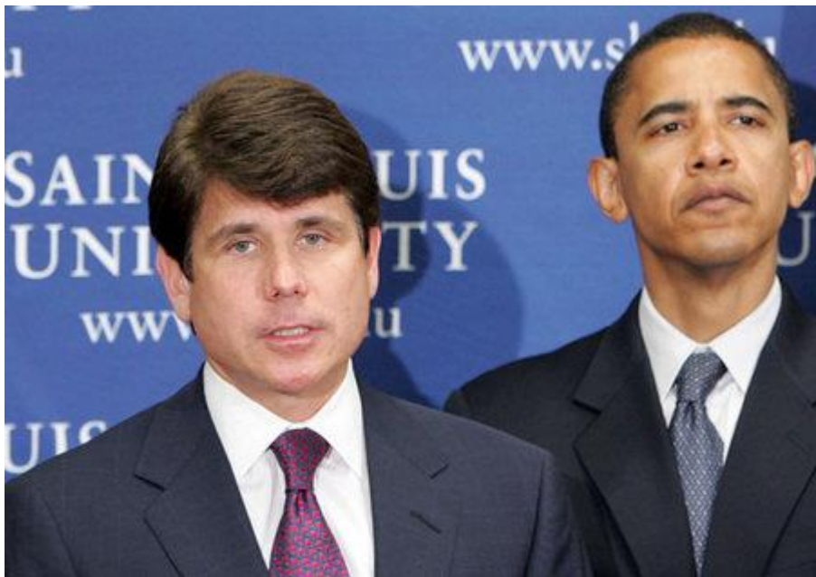
Rod Blagojevich s predsjednikom Obamom.

[Rory McCarthy, Izraelska policija preporučuje da se Avigdor Lieberman optuži za korupciju , The Guardian, 2. kolovoza 2009.]