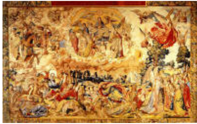
Segundo tapiz: la Justicia divina