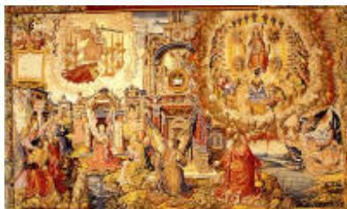
Primer tapiz: San Juan en Patmos. Las siete iglesias de Asia.