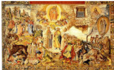
Cuarto tapiz: Los dos profetas. La Iglesia o Mujer vestida de sol.