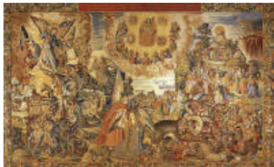
Quinto tapiz: Combates entre ángeles v demonios. Causa, la Iglesia o Mujer vestida de sol.