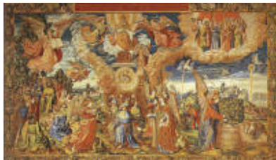
Sexto tapiz: Triunfo del Cordero Místico