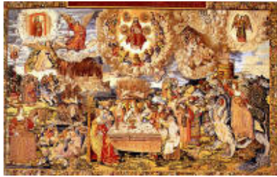
Séptimo tapiz: La meretriz y su castigo. Las bodas del Cordero.