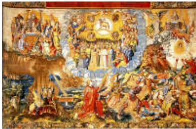
Tercer tapiz: La apoteosis del Cordero. El Juicio final.