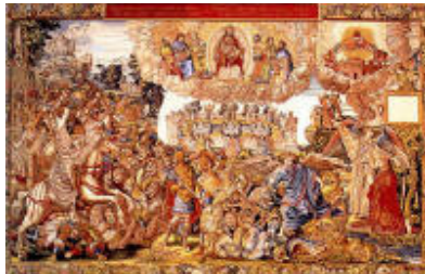
Octavo tapiz: El Triunfo de la Iglesia.