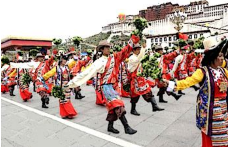
Tibet danes: ne želimo se odreči svoji pravici do izobraževanja