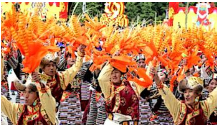
60-ta obletnica osvoboditve Tibeta: nočemo nazaj v revščino, ki smo jo živeli pod Dalai Lamo

Nasilnih dejanj in uničenja, ki jih je povzročila ljudska osvobodilna vojska, posebno tistih, ki so se izvajala v imenu kulturne revolucije v letih okrog leta 1960, na noben način ni mogoče opravičiti. Vseeno pa ne moremo zaupati v načela podpornikov razglasitve scenarija Tibeta v izgnanstvu. Pričkanje Dalai Lamine vlade v izgnanstvu, da dnevno življenje Tibetancev v lastni deželi narekujejo "mučenje, mentalni teror, diskriminacija in popolno nespoštovanje človeškega dostojanstva je čista propaganda, namenjena zbiranju simpatije ali denarnih prispevkov; takšne obtožbe ne odsevajo današnjo realnost v Tibetu. Prav tako ne sovpadajo z dejstvi prisiljene prekinitve nosečnosti in prikrite področne sterilizacije tibetanskih žena, poplavljanje dežele s strani kitajskih kolonialistov in sistematično uničevanje tibetanske kulturne dediščine.