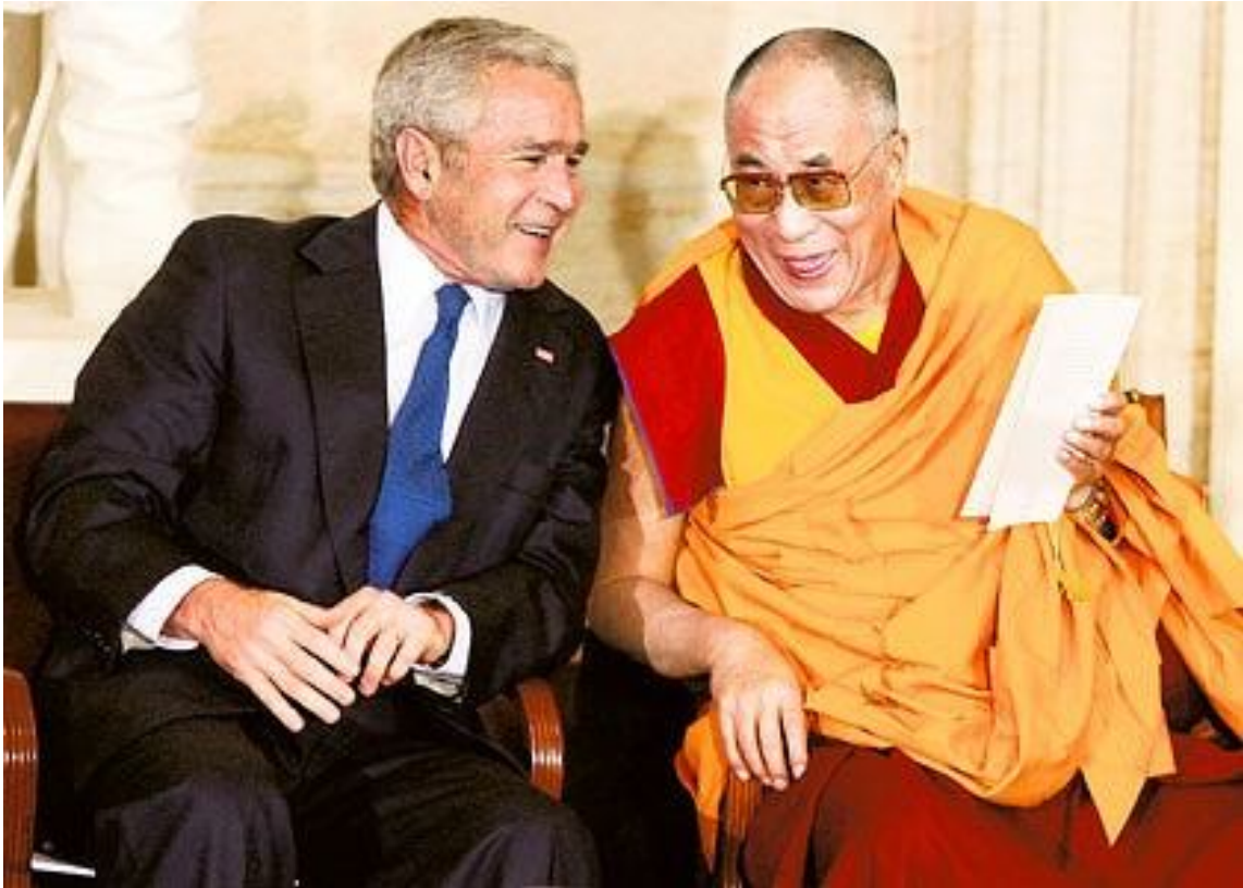
Dalai Lama in prijatelj George W. Bush