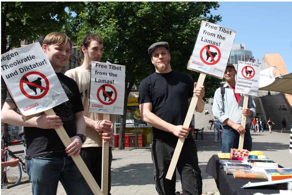
Manifest proti obisku Dalai Lame v Avstriji