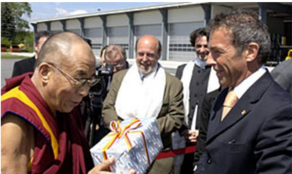
Darilo Dalai Laimi v slovo predaja Jörg Haider