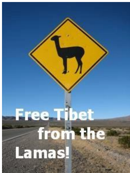
Gibanje Osvobodimo Tibet od Lam

Dalai Lamo pojmujejo v tibetanskem Budizmu z izrazom Bodhisattva, t.j. razsvetljeno bitje, ki se je reinkarniralo iz sočutja, to pomeni: zavestno ponovno – kot zgled – kot človeška eksistenca. Če tudi razsvetljeni lahko zapustijo krogotok ponovnega rojevanja, se Budhisatt-ve zaobljubijo, da se prostovoljno ponovno rodijo in tako zmanjšajo trpljenje ostalih čutečih bitij (Bodhisattva zaobljube).