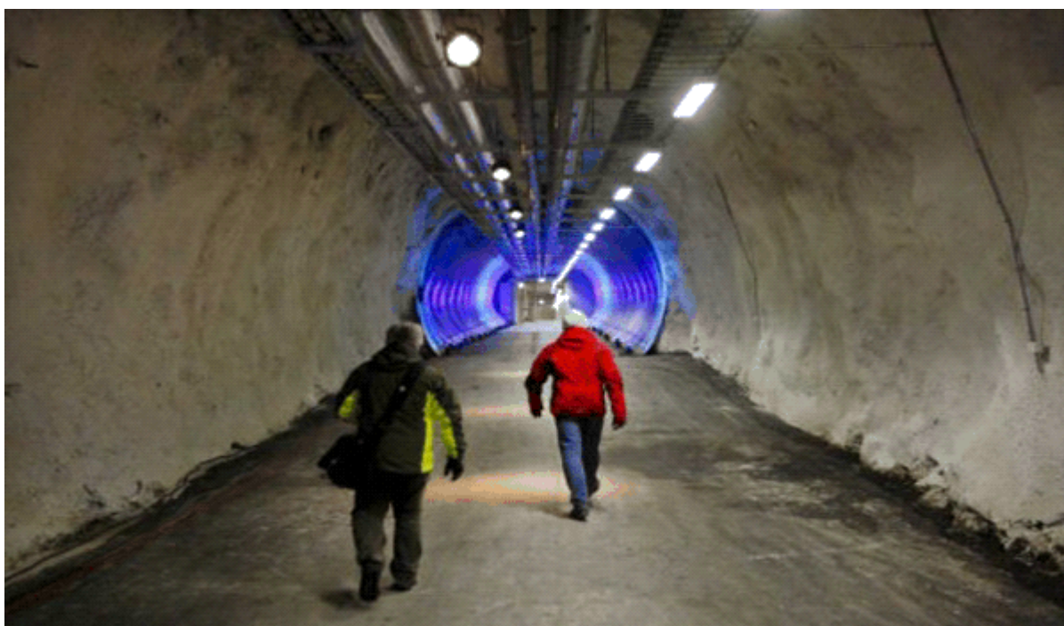
Glavni ulaz u trezor

Koju to budućnost predviđaju sponzori ovog trezora, a koja će zaprijetiti globalnoj dostupnosti sjemena jestivih biljaka?